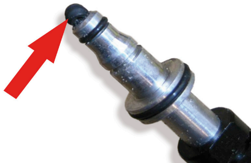
Снимка 4: Ако старото уплътнение не се отстрани, то може да се запресова в CSC и да блокира тръбичката.