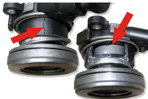
Снимка 5: Повреден от неправилен монтаж хидравличен изключващ лагер (CSC)

При смяната на CSC, системата трябва да се обезвъздуши. Процедурата по обезвъздушаване е разделена на два етапа: обезвъздушаване на съединителя и обезвъздушаване на CSC.