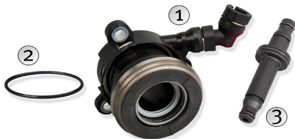
Снимка 2: LuK CSC 510 0073 10 Настояща конструкция

Снимка 1: Демонтирайте описаните по-долу детайли и ги изхвърлете по подходящ начин: Старият хидравличен изключващ лагер, CSC (1), гарнитурата на фланеца на корпуса на трансмисията (2), свързващата тръбичка (3) и пластмасовата втулка (4), която се използва за прекарването на тръбичката през корпуса на трансмисията.