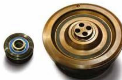
NOVI KOMPLET REMENICE SA PRIGUŠIVAČEM + REMENICA ALTERNATORA + UPUTSTVA

KOMPLET Takođe je odabrani da se u procesu studije uključi i alternator, kao komponenta sekundarnog pogonskog sistema sa većim momentom inercije. Da bi se na pomoćnom sistemu uklonile nepravilnosti osovine motora, za svaku primenu remenice osovine motora mora da se koristi relativna slobodna remenica alternatora koja je sastavni deo kompleta prenosa snage rotacije pomoćnog sistema istovremeno, što garantuje rad bez buke i vibracije. Kompleti dolaze s uputstvima za upotrebu koje sadrže i uputstva za instalaciju i detaljne informacije o modelima na koje se odnose.