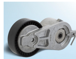
Снимка 2: Вариант 2

В изброените превозни средства са монтирани първоначално два различни варианта на обтегач за задвижване на спомагателните възли.