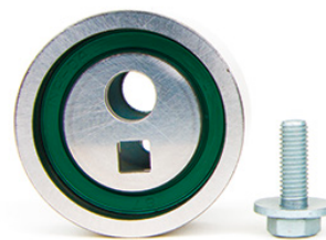
Снимка 2: 531 0780 10 - обтяжна ролка с предоставения винт

бул. Дондуков 62А, 1504 София, България Тел.: +359 2 946 3900 aftermarket.bg@schaeffler.com https://aftermarket.schaeffler.bg