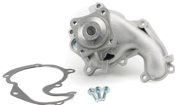
Снимка 1: Съдържание на опаковката на помпата за охлаждаща течност

За настоящият списък направете справка в каталога