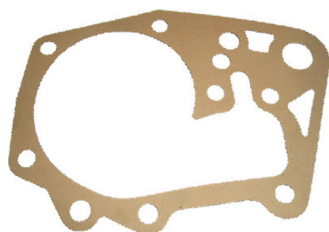
Joint en papier

L'étanchéité de la pompe se fait avec un :