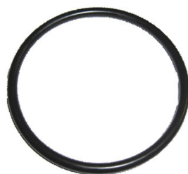
Joint torique rond

La lèvre du joint torique étant étanche, aucune pâte à joint supplémentaire ne doit être utilisée! Afin de maintenir le joint torique en position, un lubrifiant sans acide approprié peut être utilisé.