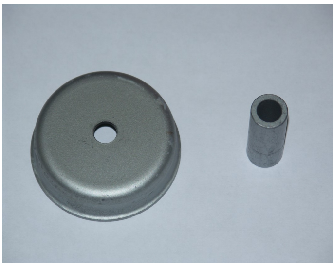
Abb. 4/Fig. 4