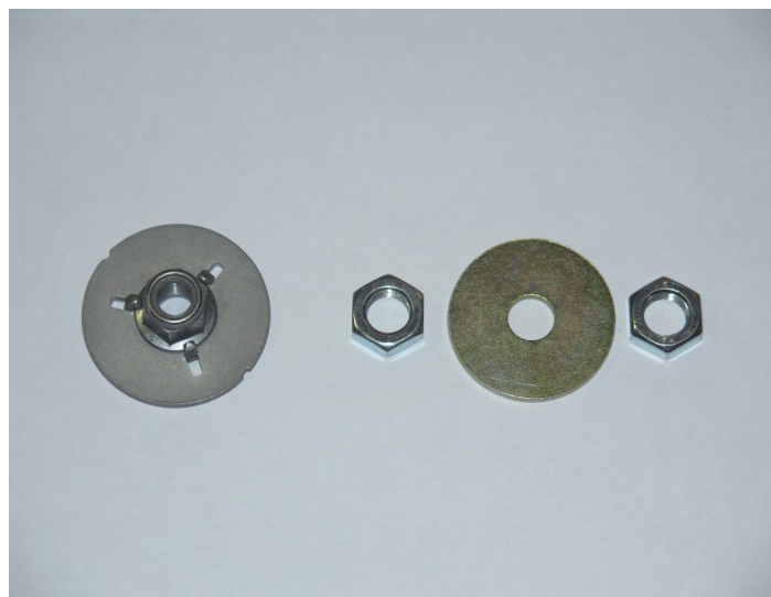
Abb. 5/Fig. 5