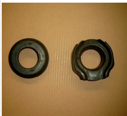
Abb. 2/Fig. 2