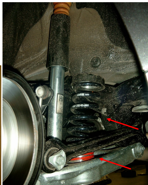
Abb. 3/Fig. 3