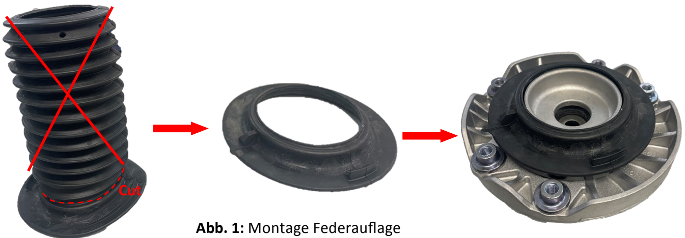
Abb. 1: Montage Federauflage Fig. 1: Mounting spring support