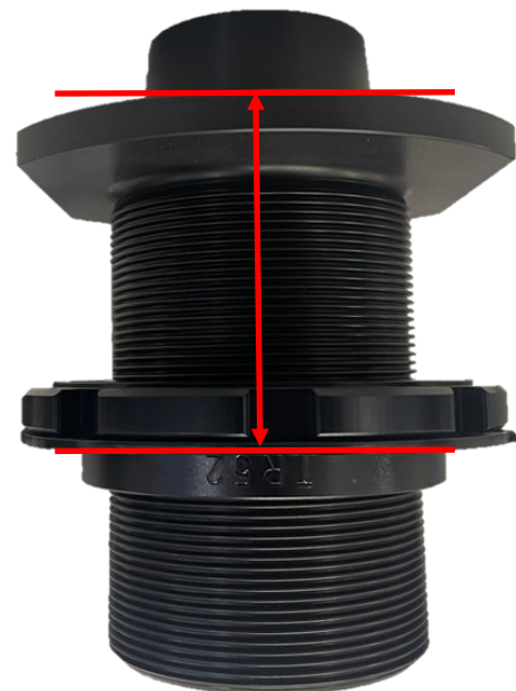
Abb. 3: Einstellmaß HA Fig. 3: RA adjustment dimension