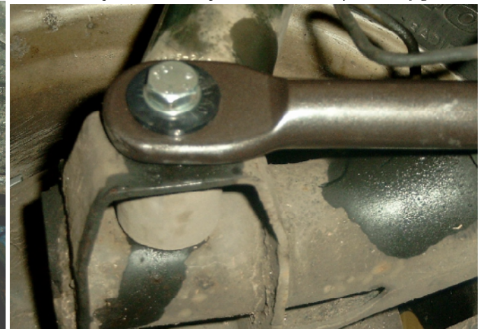
Abbildung/figure 4: Befestigung der Stabienden

Daraufhin muß das ABS-Kabel mit einem Kabelbinder wieder oben an der Hinterachse befestigt werden. Dabei ist darauf zu achten es keiner Zugbelastung ausgesetzt ist. Außerdem darf es keinen Kontakt zu beweglichen Teilen wie dem Stabilisator haben da es sonst durchgescheuert werden kann.