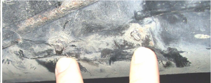
Abbildung/figure 2: Abschleifen der Stifte

Anschließend müssen die beiden Stifte wie auf Abbildung 2 zu sehen abgeschliffen werden. Danach ist der Stabilisator wie auf Abbildung 3 und 5 zu sehen an der Hinterachse zu montieren. Das Gummilager, die Halbschelle und die große Schelle sind wie in Abbildung 3 zu montieren. Dabei ist darauf zu achten das die Schellen einen Abstand von 580mm (Mitte zu Mitte) haben. Afterwards the two screws have to be grinded as you see in figure 3 and 5. The bushing, the small and the big clamp must be mounted as you could see in figure 3. Make sure that the distance from middle clamp to middle clamp must be 580mm as you see in figure 5.