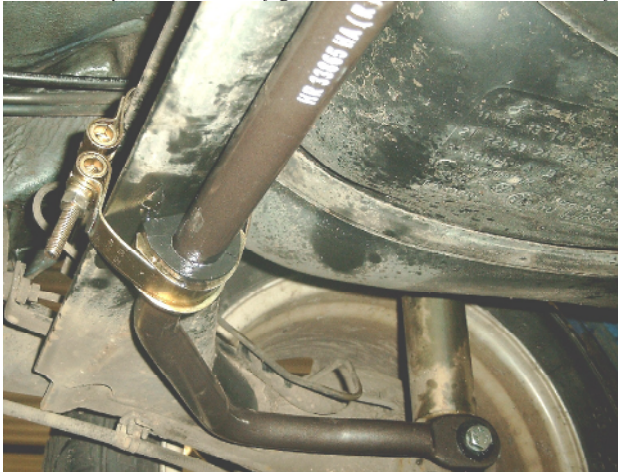
Abbildung/figure 3: Montage des Stabis

Anschließend müssen die beiden Stifte wie auf Abbildung 2 zu sehen abgeschliffen werden. Danach ist der Stabilisator wie auf Abbildung 3 und 5 zu sehen an der Hinterachse zu montieren. Das Gummilager, die Halbschelle und die große Schelle sind wie in Abbildung 3 zu montieren. Dabei ist darauf zu achten das die Schellen einen Abstand von 580mm (Mitte zu Mitte) haben. Afterwards the two screws have to be grinded as you see in figure 3 and 5. The bushing, the small and the big clamp must be mounted as you could see in figure 3. Make sure that the distance from middle clamp to middle clamp must be 580mm as you see in figure 5.