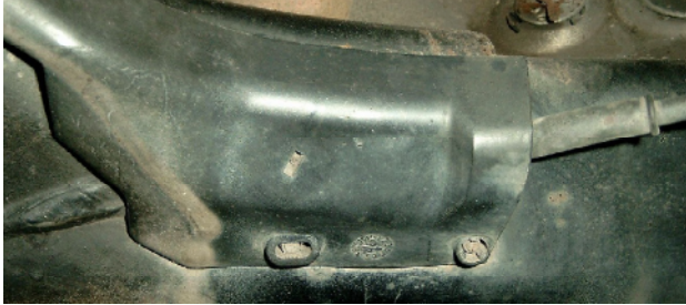
Abbildung/figure 1: Abdeckung des ABS Kabels

Vor Einbau des Hinterachsstabilisators ist bei Fahrzeugen mit ABS die Abdeckung des Kabels zu demontieren, siehe Abbildung 1. Before the installation of the rear axle stabilizer the cover of the ABS-cable has to be dismantled, see figure 1.