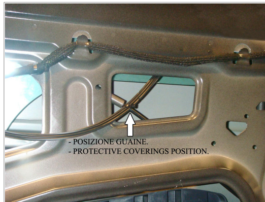
- POSIZIONE GUAINA. - PROTECTIVE COVERINGS POSITION.