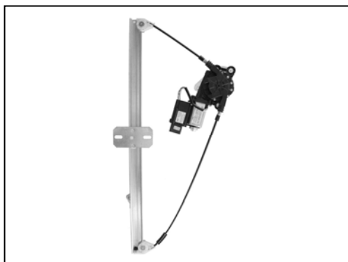
Nuestro elevallunas Our window regulator