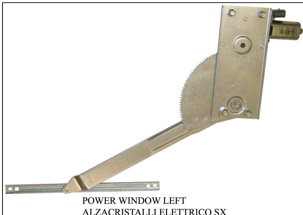
POWER WINDOW LEFT

LA PRESENTE ISTRUZIONE VALE SIA PER IL LATO SINISTRO CHE PER IL LATO DESTRO