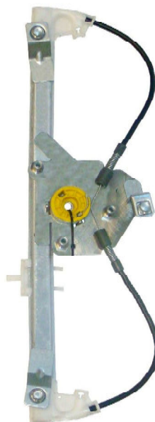
Ns meccanismo SX