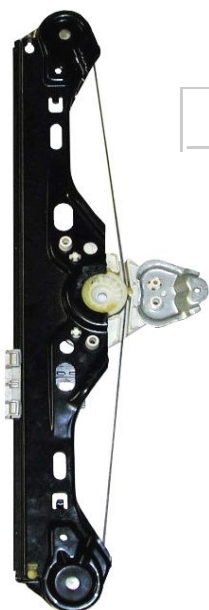
Meccanismo originale SX

TOGLIERE I SUPPORTI ORIGINALI ENLEVER LES SUPPORTS ORIGINAL REMOVE THE ORIGINAL SUPPORTS