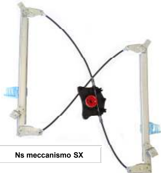
Ns meccanismo SX