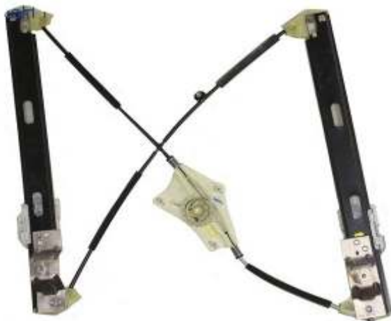
Meccanismo originale SX

SOLO MECCANISMO MECHANISM ONLY MECANISME (PAS DE MOTEUR)