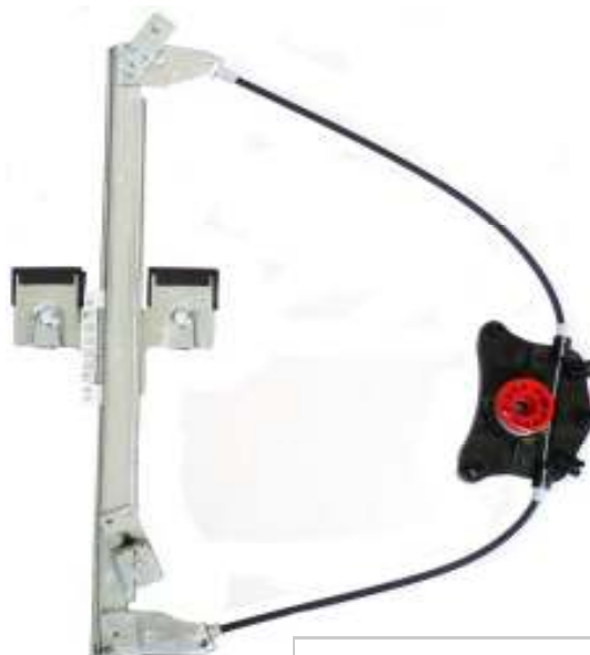
Ns meccanismo SX