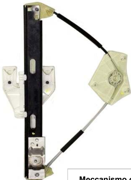
Meccanismo originale SX

SOLO MECCANISMO MECHANISM ONLY MECANISME (PAS DE MOTEUR)