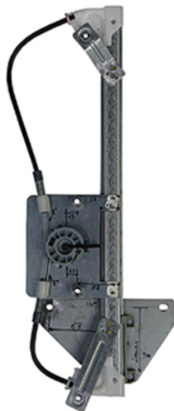
POWER IWNDOW RIGHT ALZACRISTALLI ELETTRICO DX

LA PRESENTE ISTRUZIONE VALE SIA PER IL LATO SINISTRO CHE PER IL LATO DESTRO.