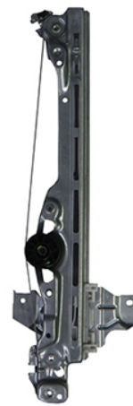
ORIGINAL POWER WINDOW RIGHT ALZACRISTALLI ELETTRICO ORIGINIALE DX