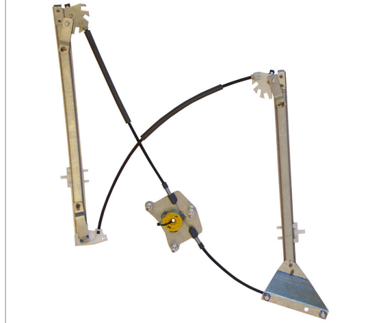
A POWER WINDOW LEFT ALZACRISTALLI ELETTRICO SX

THIS INSTALLATION INSTRUCTION IS FOR BOTH LEFT AND RIGHT SIDE. CETTE INSTRUCTION DE MONTAGE EST POUR LES DEUX COTES DROIT ET GAUCHE. DIESE MONTAGE-ANLEITUNG IST FÜR DIE BEIDE LINKE UND RECHTE SEITE. ESTA INSTRUCCION DE MONTAJE ES PARA LOS DOS LADOS IZQUIERDO Y DERECHO. ESTAS INSTRUÇÕES VALEM TANTO PARA O LADO ESQUERDO QUANTO PARA O DIREITO. LA PRESENTE ISTRUZIONE VALE SIA PER IL LATO SINISTRO CHE PER IL LATO DESTRO.