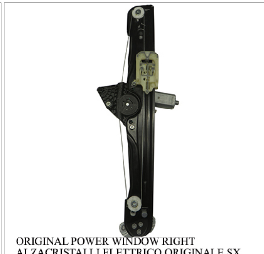
ORIGINAL POWER WINDOW RIGHT ALZACRISTALLI ELETTRICO ORIGINALE SX