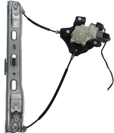
ORIGINAL POWER WINDOW RIGHT ALZACRISTALLI ELETTRICXO ORIGINALE DX