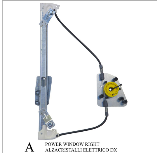
A POWER WINDOW RIGHT ALZACRISTALLI ELETTRICO DX

THIS INSTALLATION INSTRUCTION IS FOR BOTH LEFT AND RIGHT SIDE. CETTE INSTRUCTION DE MONTAGE EST POUR LES DEUX COTES DROIT ET GAUCHE. DIESE MONTAGE-ANLEITUNG IST FÜR DIE BEIDE LINKE UND RECHTE SEITE. ESTA INSTRUCCION DE MONTAJE ES PARA LOS DOS LADOS IZQUIERDO Y DERECHO. ESTAS INSTRUÇÕES VALEM TANTO PARA O LADO ESQUERDO QUANTO PARA O DIREITO. DEZE AANWIJZINGEN GELDEN VOOR ZOWEL DE LINKER- ALS DE RECHTERKANT. Η ΠΑΡΟΥΣΑ ΟΔΗΓΙΑ ΑΦΟΡΑ ΤΟΣΟ ΤΗΝ ΑΡΙΣΤΕΡΗ ΟΣΟ ΚΑΙ ΤΗ ΔΕΞΙΑ ΠΛΕΥΡΑ. LA PRESENTE ISTRUZIONE VALE SIA PER IL LATO SINISTRO CHE PER IL LATO DESTRO.