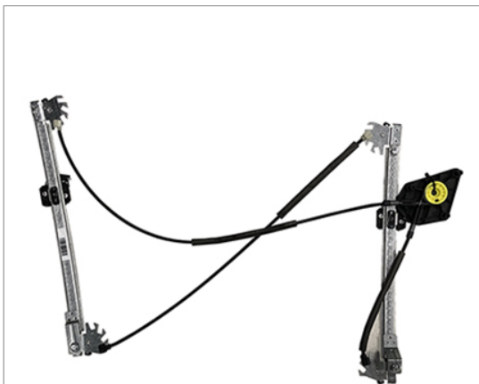
A POWER WINDOW LEFT ALZACRISTALLI ELETTRICO SX

THIS INSTALLATION INSTRUCTION IS FOR BOTH LEFT AND RIGHT SIDE. CETTE INSTRUCTION DE MONTAGE EST POUR LES DEUX COTES DROIT ET GAUCHE. DIESE MONTAGE-ANLEITUNG IST FÜR DIE BEIDE LINKE UND RECHTE SEITE. ESTA INSTRUCCION DE MONTAJE ES PARA LOS DOS LADOS IZQUIERDO Y DERECHO. ESTAS INSTRUÇÕES VALEM TANTO PARA O LADO ESQUERDO QUANTO PARA O DIREITO. LA PRESENTE ISTRUZIONE VALE SIA PER IL LATO SINISTRO CHE PER IL LATO DESTRO.