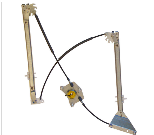
A POWER WINDOW LEFT ALZACRISTALLI ELETTRICO SX

THIS INSTALLATION INSTRUCTION IS FOR BOTH LEFT AND RIGHT SIDE. CETTE INSTRUCTION DE MONTAGE EST POUR LES DEUX COTES DROIT ET GAUCHE. DIESE MONTAGE-ANLEITUNG IST FÜR DIE BEIDE LINKE UND RECHTE SEITE. ESTA INSTRUCCION DE MONTAJE ES PARA LOS DOS LADOS IZQUIERDO Y DERECHO. ESTAS INSTRUÇÕES VALEM TANTO PARA O LADO ESQUERDO QUANTO PARA O DIREITO. LA PRESENTE ISTRUZIONE VALE SIA PER IL LATO SINISTRO CHE PER IL LATO DESTRO.