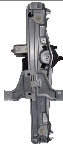
ORIGINAL POWER WINDOW RIGHT ALZACRISTALLI ELETTRICO ORIGINALE DX