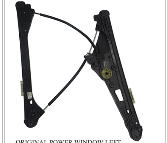
ORIGINAL POWER WINDOW LEFT ALZACRISTALLI ELETTRICO ORIGIANLE SX