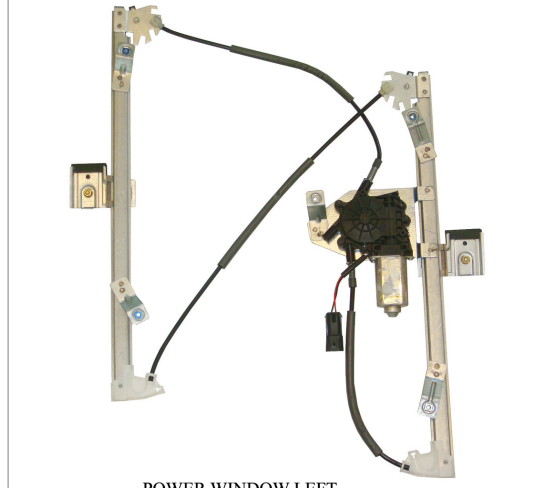
POWER WINDOW LEFT ALZACRISTALLI ELETTRICO SX

THIS INSTALLATION INSTRUCTION IS FOR BOTH LEFT AND RIGHT SIDE. CETTE INSTRUCTION DE MONTAGE EST POUR LES DEUX COTES DROIT ET GAUCHE. DIESE MONTAGE-ANLEITUNG IST FÜR DIE BEIDE LINKE UND RECHTE SEITE. ESTA INSTRUCCION DE MONTAJE ES PARA LOS DOS LADOS IZQUIERDO Y DERECHO. ESTAS INSTRUÇÕES VALEM TANTO PARA O LADO ESQUERDO QUANTO PARA O DIREITO. LA PRESENTE ISTRUZIONE VALE SIA PER IL LATO SINISTRO CHE PER IL LATO DESTRO.