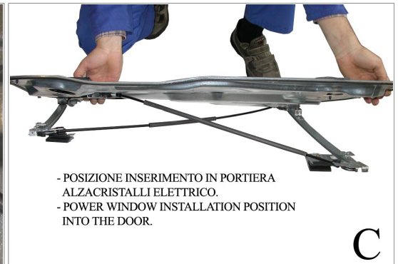
- POSIZIONE INSERIMENTO IN PORTIERA ALZACRISTALLI ELETTRICO. - POWER WINDOW INSTALLATION POSITION INTO THE DOOR.