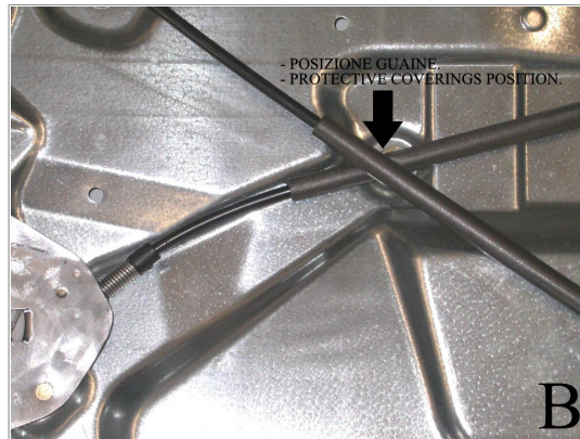
- POSIZIONE GUAINA - PROTECTIVE COVERINGS POSITION.