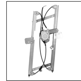
Nostro alzacristallo – our window regulator – notre lève-vitre – unser Fensterheber – nuestro elevalunas – nosso levantador de vidro - bizim cam acacagi - ρύλος δικός μας