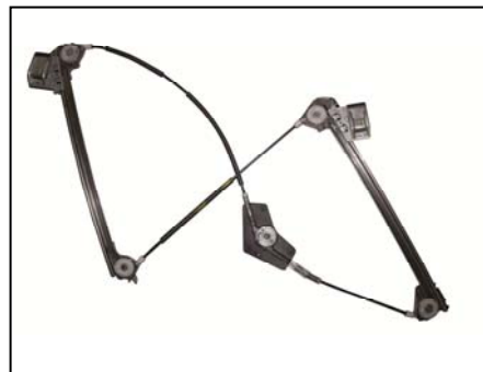
Nostro alzacristallo – our window regulator – notre lève-vitre – unser Fensterheber – nuestro elevallunas – nosso levantador de vidro - bizim cam acacagi - Γρύλος δικός μας