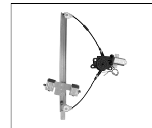
Nostro alzacrystallo – our window regulator – notre lève-vitre – unser Fensterheber – nuestro elevallunas – nosso levantador de vidro - bizim cam acacagi - Γρύλος δικός μας