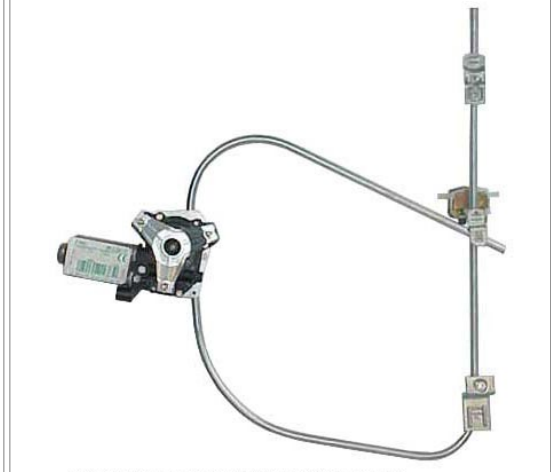
ORIGINAL POWER WINDOW RIGHT ALZACRISTALLI ELETTRICO ORIGINALE DX