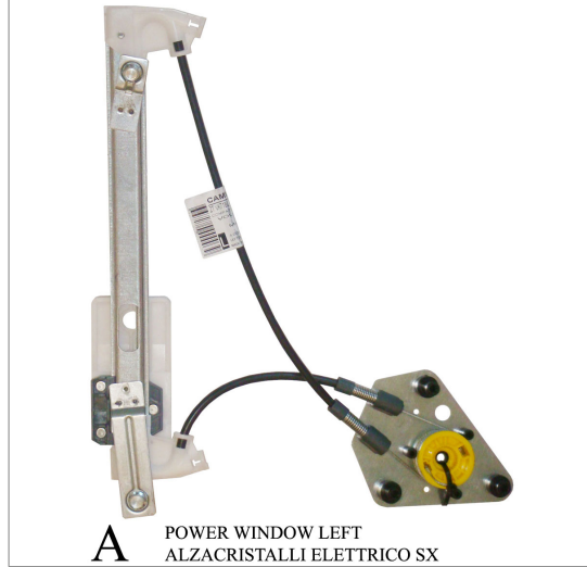
A POWER WINDOW LEFT ALZACRISTALLI ELETTRICO SX

THIS INSTALLATION INSTRUCTION IS FOR BOTH LEFT AND RIGHT SIDE. CETTE INSTRUCTION DE MONTAGE EST POUR LES DEUX COTES DROIT ET GAUCHE. DIESE MONTAGE-ANLEITUNG IST FÜR DIE BEIDE LINKE UND RECHTE SEITE. ESTA INSTRUCCION DE MONTAJE ES PARA LOS DOS LADOS IZQUIERDO Y DERECHO. ESTAS INSTRUÇÕES VALEM TANTO PARA O LADO ESQUERDO QUANTO PARA O DIREITO. LA PRESENTE ISTRUZIONE VALE SIA PER IL LATO SINISTRO CHE PER IL LATO DESTRO.