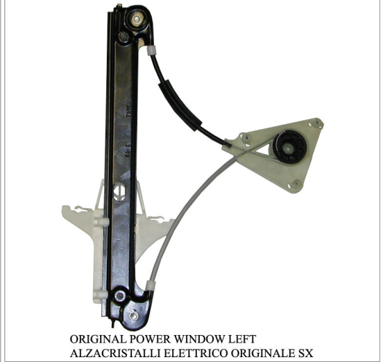
ORIGINAL POWER WINDOW LEFT ALZACRISTALLI ELETTRICO ORIGINALE SX