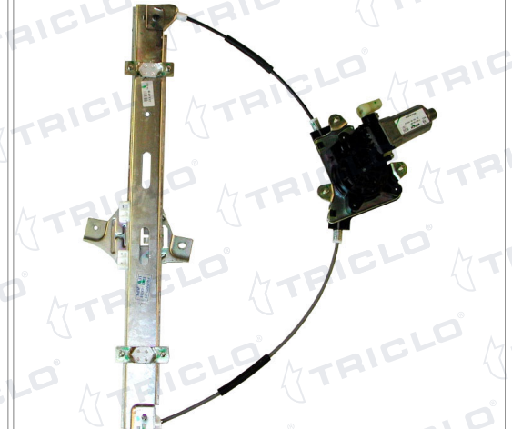
ORIGINAL POWER WINDOW LEFT ALZACRISTALLI ELETTRICO ORIGINALE SX