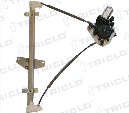
POWER WINDOW LEFT ALZACRISTALLI ELETTRICO SX

THIS INSTALLATION INSTRUCTION IS FOR BOTH LEFT AND RIGHT SIDE. CETTE INSTRUCTION DE MONTAGE EST POUR LES DEUX COTES DROIT ET GAUCHE. DIESE MONTAGE-ANLEITUNG IST FÜR DIE BEIDE LINKE UND RECHTE SEITE. ESTA INSTRUCCION DE MONTAJE ES PARA LOS DOS LADOS IZQUIERDO Y DERECHO. ESTAS INSTRUÇÕES VALEM TANTO PARA O LADO ESQUERDO QUANTO PARA O DIREITO. LA PRESENTE ISTRUZIONE VALE SIA PER IL LATO SINISTRO CHE PER IL LATO DESTRO.