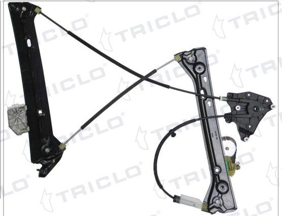
ORIGINAL POWER WINDOW LEFT ALZACRISTALLI ELETTRICO ORIGINALE SX