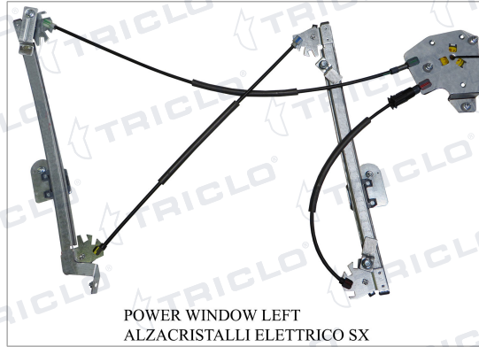
POWER WINDOW LEFT ALZACRISTALLI ELETTRICO SX

THIS INSTALLATION INSTRUCTION IS FOR BOTH LEFT AND RIGHT SIDE. CETTE INSTRUCTION DE MONTAGE EST POUR LES DEUX COTES DROIT ET GAUCHE. DIESE MONTAGE-ANLEITUNG IST FÜR DIE BEIDE LINKE UND RECHTE SEITE. ESTA INSTRUCCION DE MONTAJE ES PARA LOS DOS LADOS IZQUIERDO Y DERECHO. ESTAS INSTRUÇÕES VALEM TANTO PARA O LADO ESQUERDO QUANTO PARA O DIREITO. DEZE AANWIJZINGEN GELDEN VOOR ZOWEL DE LINKER- ALS DE RECHTERKANT. Η ΠΑΡΟΥΣΑ ΟΔΗΓΙΑ ΑΦΟΡΑ ΤΟΣΟ ΤΗΝ ΑΡΙΣΤΕΡΗ ΟΣΟ ΚΑΙ ΤΗ ΔΕΞΙΑ ΠΛΕΥΡΑ. LA PRESENTE ISTRUZIONE VALE SIA PER IL LATO SINISTRO CHE PER IL LATO DESTRO.