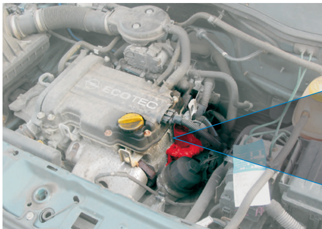
Válvula eléctrica EGR en un Opel Corsa (destacada)