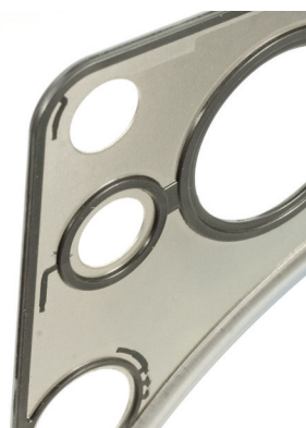
61-34285-20_Anellino di tenuta sottile