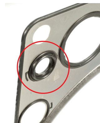
61-37770-00_Anellino di tenuta spessore 3 mm