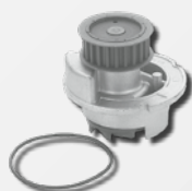
SWAG 40 15 0029 para motor 1.8l