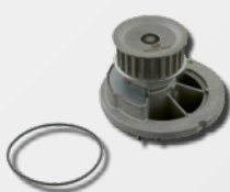
SWAG 40 92 4314 para motor 1.4l e 1.6l 16V