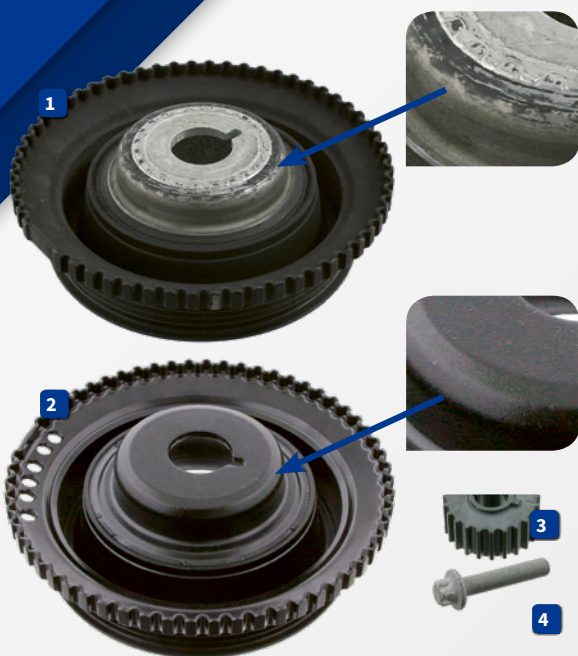
Opel 5614 430

Para mais informação, visite: partsfinder.bilsteingroup.com