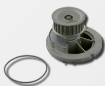
SWAG no. 40 92 4314 penu motorul 16 V de 1,4l și 1,6l

For more technical information please visit: partsfinder.bilsteingroup.com