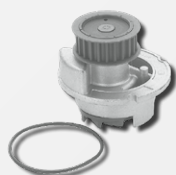
SWAG no. 40 15 0029 penu motorul 16 V de 1,8l