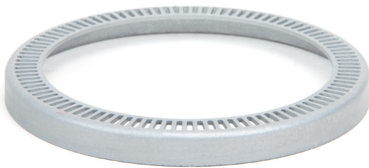
Bague de capteur ABS réf. 434 0498 10

En cas de besoin, la bague de capteur nécessaire à la réparation du roulement de roue d'un véhicule avec système ABS peut être commandée séparément au détail. Les bagues de capteur ABS sont répertoriées comme tel tant dans notre catalogue papier que sur notre catalogue en ligne.