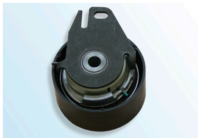
1. ábra: OE típus

A fent nevezett modelleknél két különböző feszítőgörgő-típus lehet beszerelve.