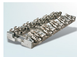
Bild 2: Vipparmsbrygga 423 0063 10

Fordonstillverkarna Citroën, Fiat, Ford, Land Rover och Peugeot inför nu nya serier av dieselmotorer, som uppfyller kraven i utsläppsnormen Euro 4.