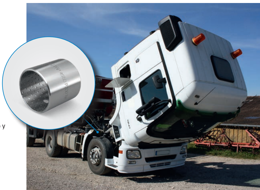
Alojamiento con casquillo de cojinete KS Permaglide® Tipo de construcción PAP ... P200