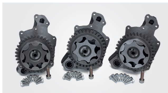
Pompy oleju MAN

Prawo do zmian i odchyłeń rysunków zastrzeżone. Przy porządkowaniu i części zastępcze patrz obowiązujące katalogi lub systemy oparte na danych TecAlliance.