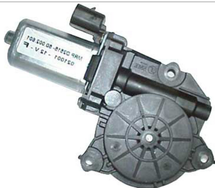
MOTOR LEFT MOTORE SX

THIS INSTALLATION INSTRUCTION IS FOR BOTH LEFT AND RIGHT SIDE. CETTE INSTRUCTION DE MONTAGE EST POUR LES DEUX COTES DROIT ET GAUCHE. DIESE MONTAGE-ANLEITUNG IST FÜR DIE BEIDE LINKE UND RECHTE SEITE. ESTA INSTRUCCION DE MONTAJE ES PARA LOS DOS LADOS IZQUIERDO Y DERECHO. ESTAS INSTRUÇÕES VALEM TANTO PARA O LADO ESQUERDO QUANTO PARA O DIREITO. DEZE AANWIJZINGEN GELDEN VOOR ZOWEL DE LINKER- ALS DE RECHTERKANT. Η ΠΑΡΟΥΣΑ ΟΔΗΓΙΑ ΑΦΟΡΑ ΤΟΣΟ ΤΗΝ ΑΡΙΣΤΕΡΗ ΟΣΟ ΚΑΙ ΤΗ ΔΕΞΙΑ ΠΛΕΥΡΑ. LA PRESENTE ISTRUZIONE VALE SIA PER IL LATO SINISTRO CHE PER IL LATO DESTRO.