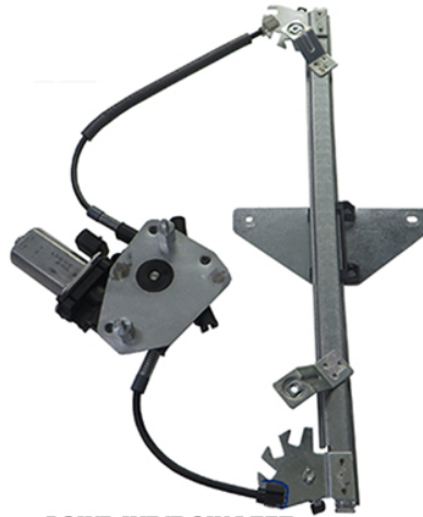
POWR WINDOW LEFT ALZACRISTALLI LETTRICO SX

THIS INSTALLATION INSTRUCTION IS FOR BOTH LEFT AND RIGHT SIDE. CETTE INSTRUCTION DE MONTAGE EST POUR LES DEUX COTES DROIT ET GAUCHE. DIESE MONTAGE-ANLEITUNG IST FÜR DIE BEIDE LINKE UND RECHTE SEITE. ESTA INSTRUCCION DE MONTAJE ES PARA LOS DOS LADOS IZQUIERDO Y DERECHO. AS PRESENTES INSTRUÇÕES VALEM TANTO PARA O LADO ESQUERDO QUANTO PARA O DIREITO. DEZE INSTRUCTIE IS GELDIG VOOR ZOWEL DE LINKERKANT ALS DE RECHTERKANT. ΑΥΤΗ Η ΟΔΗΓΙΑ ΕΧΕΙ ΚΑΙ ΤΗΝ ΑΡΙΣΤΕΡΗ ΠΛΕΥΡΑ ΚΑΙ ΤΗΝ ΣΩΣΤΗ ΠΛΕΥΡΑ. LA PRESENTE ISTRUZIONE VALE SIA PER IL LATO SINISTRO CHE PER IL LATO DESTRO.