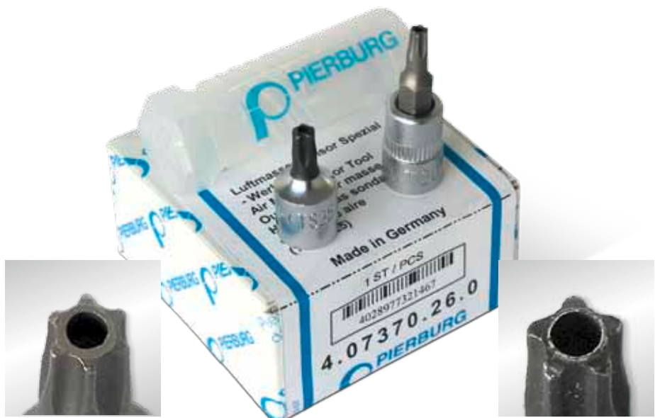
Вставка T 20 (6-лучевая, Torx®) с торцовым отверстием

Замена серийно установленных датчиков массы воздуха затруднена вследствие того, что они крепятся специальными винтами. Фирма Motor Service предлагает для данного ремонта комплект специальных инструментов, состоящий из 2 вставок. Особенностью специальных винтов является наличие штифта, который устанавливается по центру 5- или 6-лучевой профиля винта. Наличие торцового отверстия во вставках позволяет отворачивать эти специальные винты. Оба инструмента представляют собой вставки 1/4 дюйма известного качества фирмы MSI, которые подходят ко всем обычным трещоткам или торцевым ключам на 1/4 дюйма.