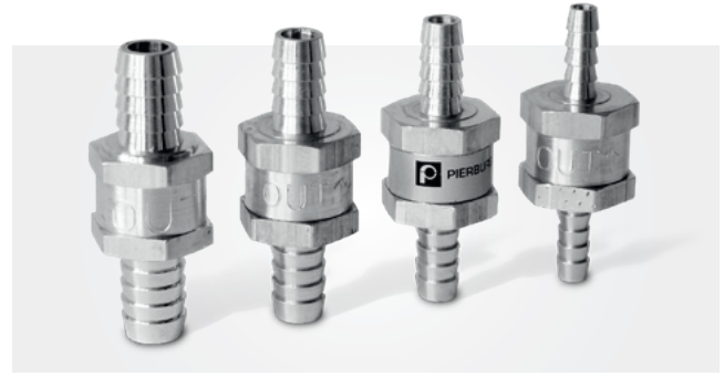
Yakıt çekvalfleri 6 – 12 mm

Alüminyum ile birleştiğinde korozyona veya temas korozyonuna neden olabilecek malzeme çiftleri kullanılmamalıdır: örn. Tuzlu su veya çinko kaplı yüzeyler.