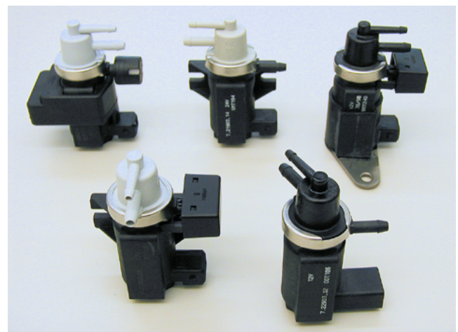
Fig. 1 : Vue de produits Convertisseur de pression

Le convertisseur de pression concerné n'est pas défectueux. Il est seulement perturbé par la résonance de la colonne d'air oscillant dans le tuyau de raccordement.