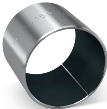
Bague de coussinet Permaglide® type de construction PAP ... P180