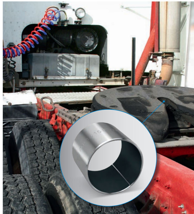
Alojamiento en quinta rueda con casquillos de cojinete Permaglide® P180

Para el alojamiento, se insertan a presión casquillos de cojinete Permaglide® P180 en las piezas de cierre. Los cojinetes