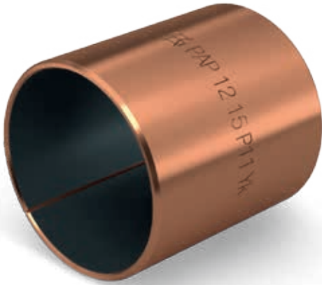
Baguette de coussinet KS PERMAGLIDE® type de construction PAP ... P11