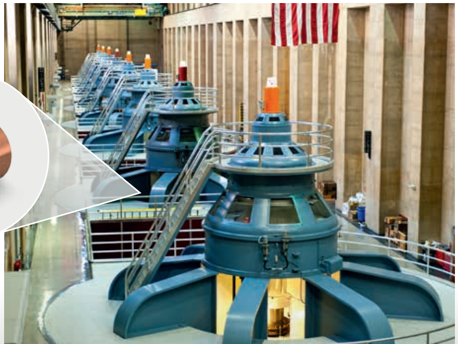
Turbine Hoover Damm